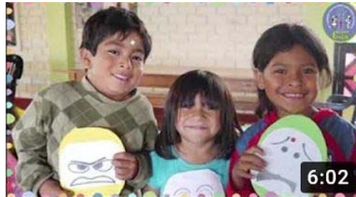
LENTCH UND DIE FOLGEN DER PANDEMIE (Lentch y la...

https://www.youtube.com/watch?v=4Qr5q8lJqbw